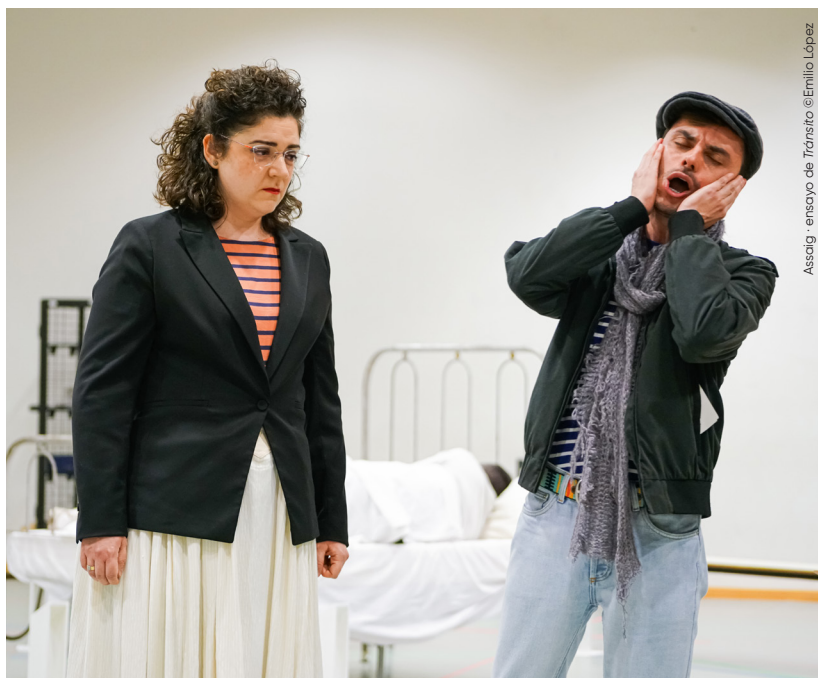
Assaig - ensayo de Tránsito

Tránsito de Torres, Orphèe de Glass y Arabella de Strauss. A partir de la temporada 2024-2025 serà profesor de la Cátedra Zubin Mehta de Dirección de Orquesta de la Escuela Reina Sofía. Debutó en Les Arts con Trouble in Tahiti .