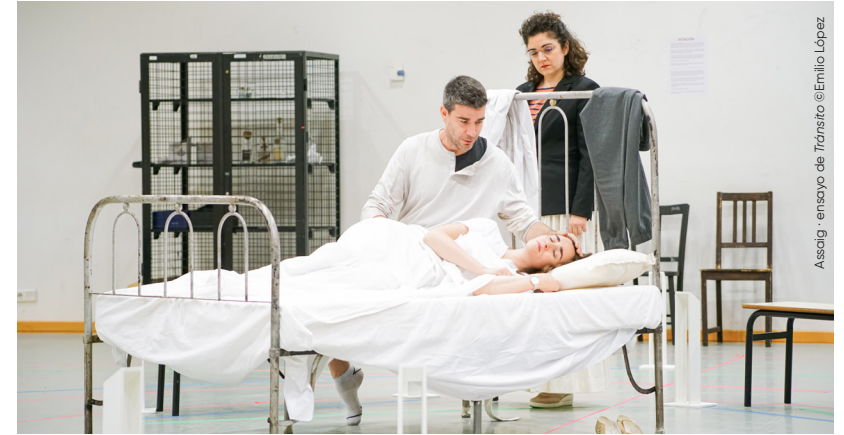
Assaig · ensayo de Tránsito

Emilio, el personatge que va crear Max Aub (1903–1972) en l'obra de teatre curt titulada Tránsito (1944), bé va poder ser un dels milers de republicans espanyols que van ser acollits a Mèxic després de la Guerra Civil. O tal vegada, va ser el mateix Max, a qui el seu amic Francisco Ayala va etiquetar com "el més exiliat de tots". I és que, l'escriptor, i potser també el seu protagonista, abans d'arribar-hi, va patir un llarg i penós pelegrinatge que va començar a París quan tenia onze anys. Amb l'esclat de la I Guerra Mundial, la seua família va marxar per a instal·lar-se a València —carrer Almirall Cadarso, 13—. No obstant això, per al jove Max, aquells anys en què passaria per l'Escola Moderna, l'Alliance Française i l'Institut Lluís Vives van ser feliços. Conegut és l'adagi tantes vegades repetit: "un és d'on va estudiar batxillerat" ( La gallina ciega ).